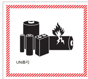
リチウム電池マーク 電話番号記載必要なし（記載のラベルは2026/12/31まで使用可能）

最少寸法は100x 100mm、 パッケージがフルサイズのマーク表示できない場合、デザインはそのまま 100（幅）x 70（高さ）mmに縮小可能